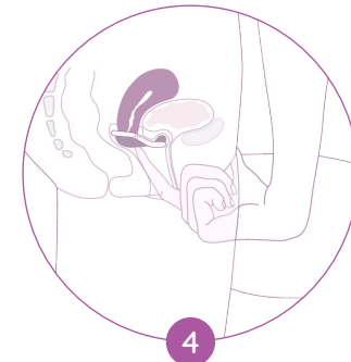
4 Vérifier que le col de l'utérus soit recouvert