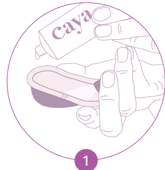
1 Appliquer du gel dans le diaphragme

Écologique et économique, le diaphragme à taille unique n'a besoin d'être changé que tous les 2 ans.